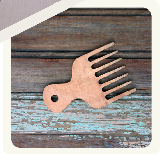
Peine Rulos Sentida Botanica